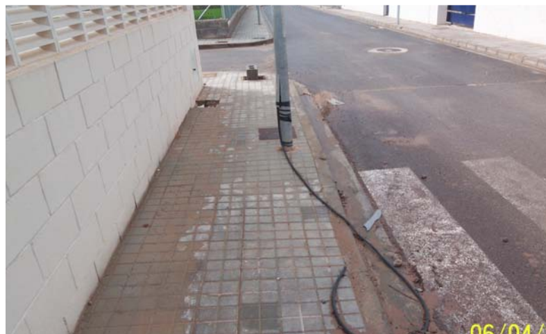
Eso, sí, las calles lucen sus mejores galas!