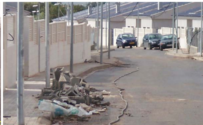
Aqui un montoncito de escombros.