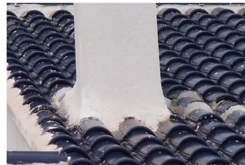
Goteras.....casi seguro el proximo otoño.