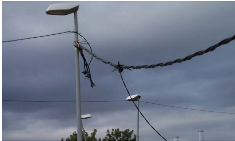
Farola, farolita, que bien aguantas la lucecita!