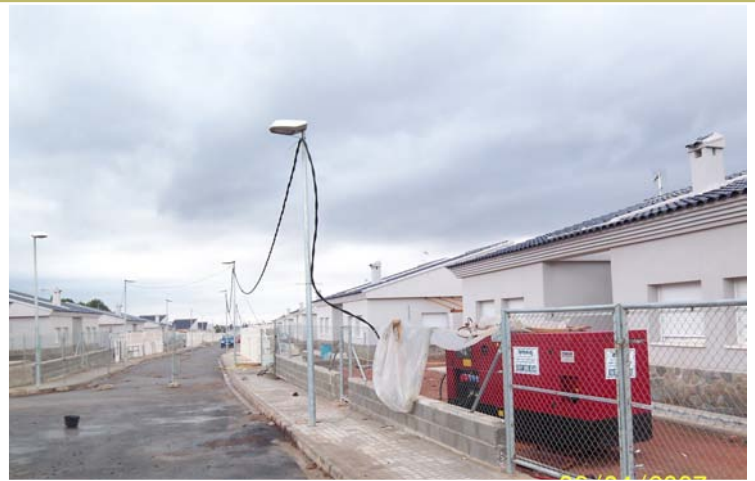
Y para toda la calle...