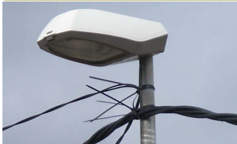
Aqui, los cables, las bridas...ah! y la farola.

Este es el urbanismo que quieren para Olocau