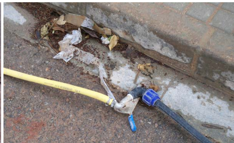
Con llave de paso....y todo.