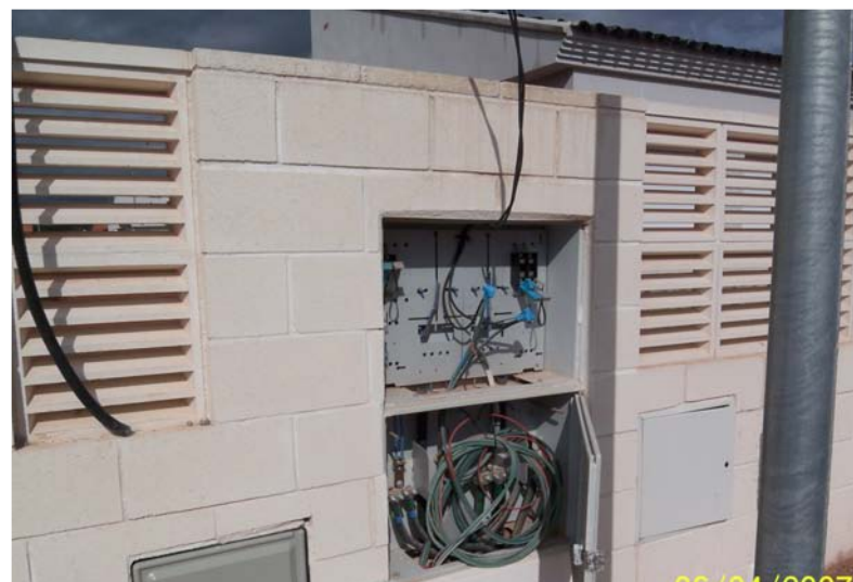
Esta es la acometida eléctrica del chalet que me compre!