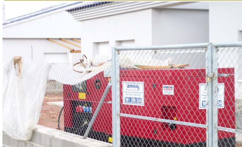
Electricidad enlatada, de compresor.

Este es el urbanismo que quieren para Olocau