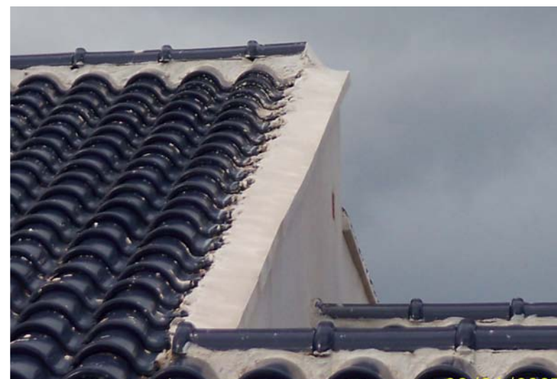
Todo por ahorrarse unas cuantas tejas!