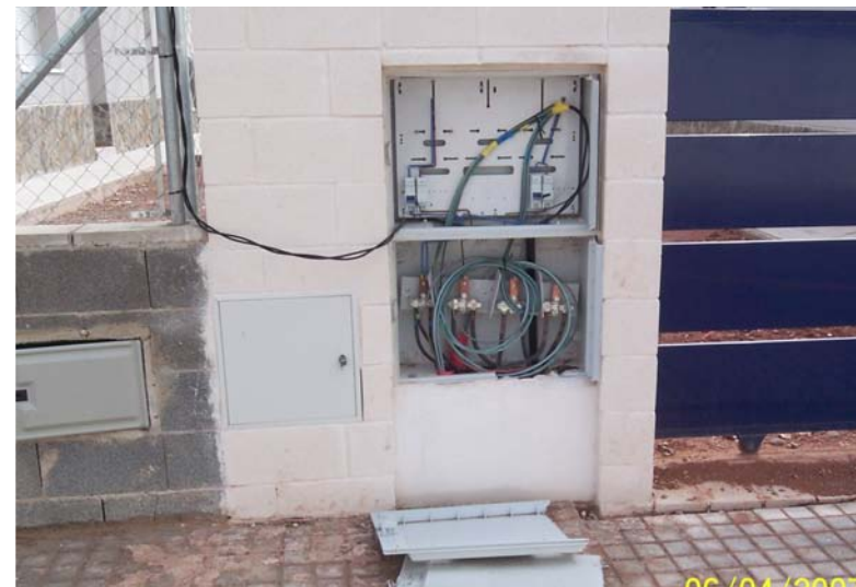
Y esta otra la de mi vecino....