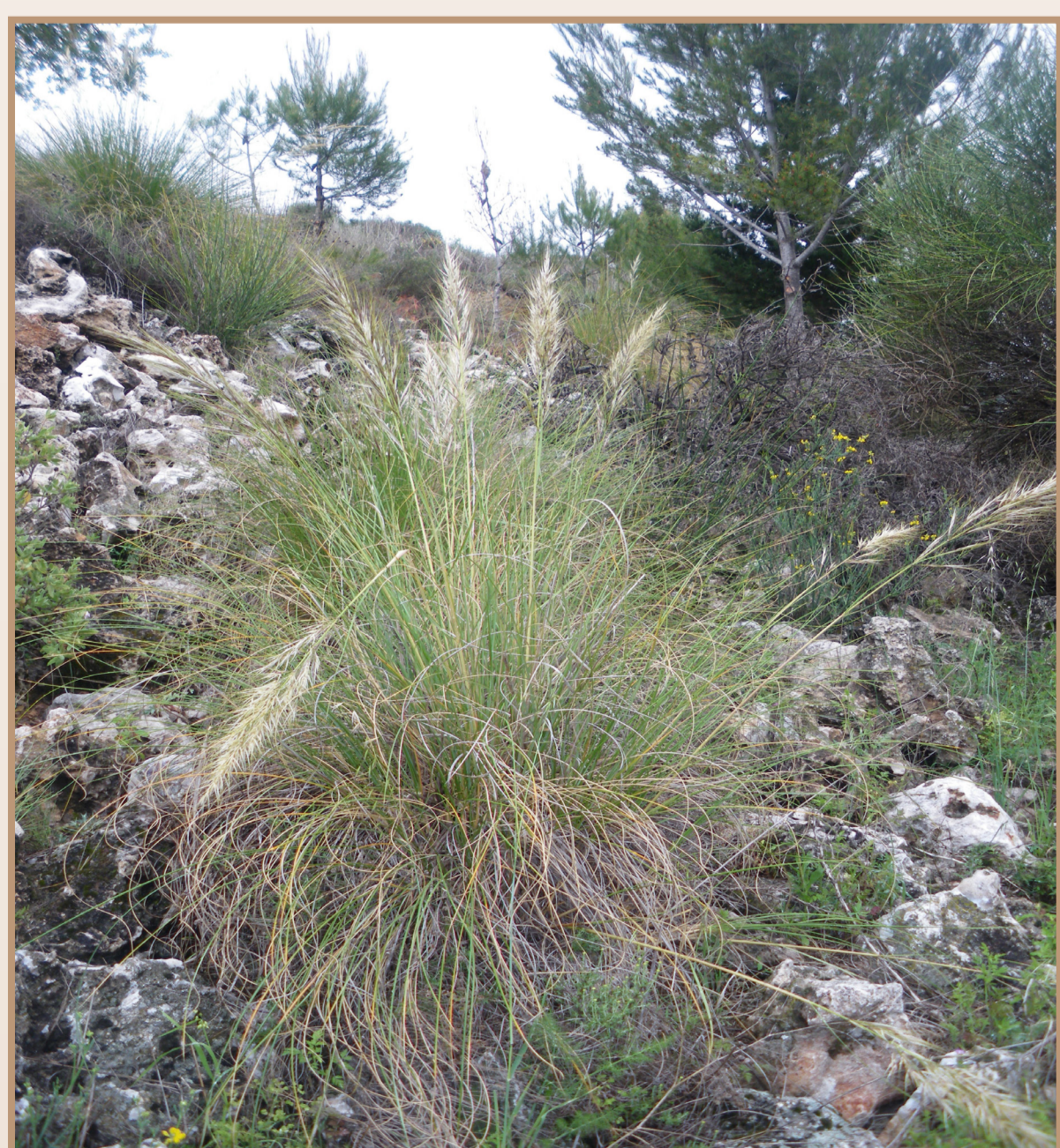
Espart. MV Fuentes