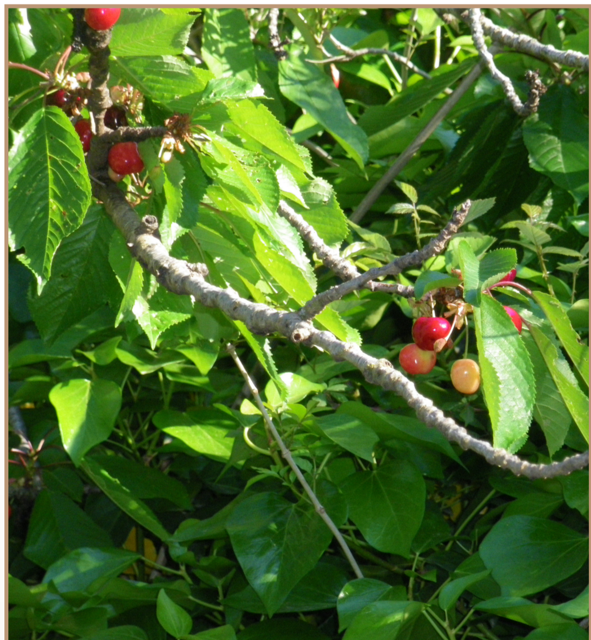
Cirerer. MV Fuentes

El poblament de la Serra ha estat fecund; cada època històrica ha deixat una particular impronta. Els seus habitants es van dedicar al llarg dels segles a la producció de carbó vegetal que proveïa les cuines de la ciutat de València i a abastir algunes llars amb l'aigua de la Serra. També van aconseguir anomenada en els treballs artesans derivats de l'espart i la palma de margalló (espartenyas, cordes, cabassos, cofins, caragoleres, graneres, estores...), que feien alternant amb el treball agrari. Respecte a les produccions que donava la natura, font principal del treball dels habitants fins les darreres dècades del segle XX, han estat els conreus de la garrofera, la figuera, l'olivera, el moscatell i els fruiters (com cirerers, pruneres, magraners, codonyers...) Tot un món que atreïa als habitants de l'Horta, que periòdicament es desplaçaven amb els seus carros, per abastir-se de garrofes, de figues i, especialment, de l'oli, recollit de les olives dites serranes, que tan apreciat era en les llars d'aquells llauradors. Però,