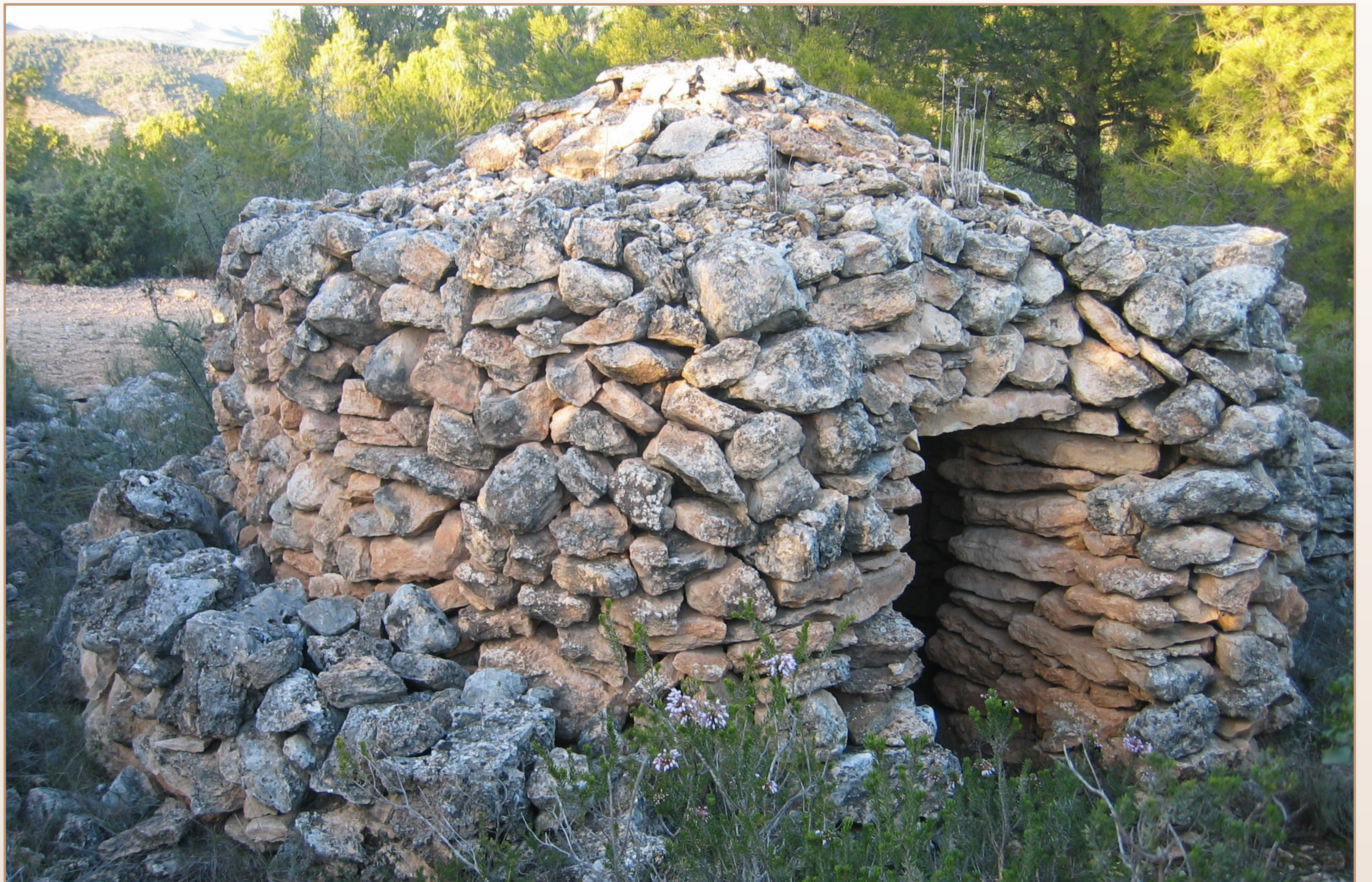
Catxirulo de pedra seca (Olocau)