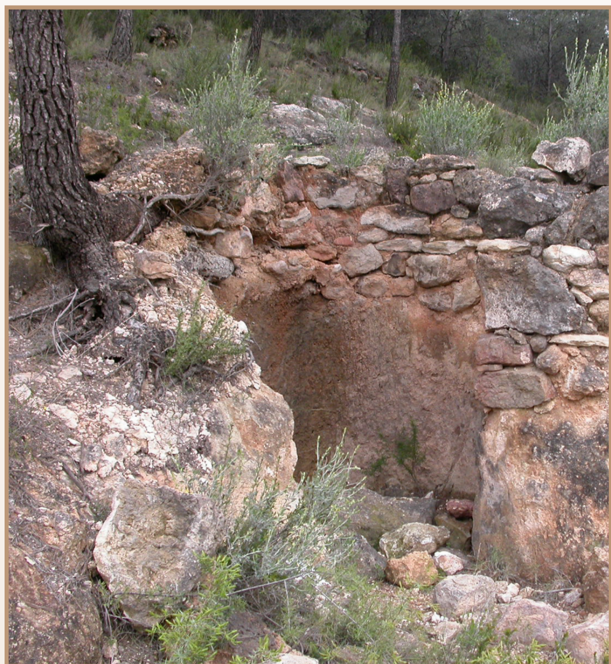
Calera (Olocau). MV Fuentes

Podem aconseguir altres models partint dels valors que representa un Parc Natural? Aquest és el repte d'aquells habitants de la serra que volem seguir vivint d'ella. Les polítiques futures relacionades amb els habitants de l'àrea d'un parc natural hauran de ser dinamitzadores d'oficis i treballs implicats en una indústria agroalimentària (etiqueta ecològica, denominació d'origen, etc), recursos forestals i actualització de serveis que assegurin unes expectatives de guany econòmic de tots aquells dedicats a elles i garanteixen unes condicions de vida dignes als que habitem la Serra.